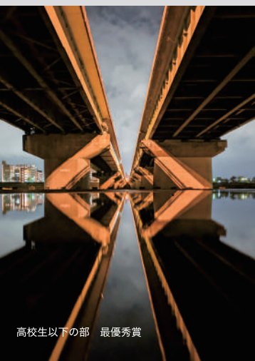
高校生以下の部 最優秀賞

後援 国土交通省九州地方整備局宮崎河川国道事務所 宮崎県/宮崎日日新聞社 一般社団法人 宮崎県建設業協会 一般社団法人 宮崎県測量設計業協会 一般社団法人 宮崎県建築士事務所協会