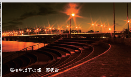
高校生以下の部 優秀賞